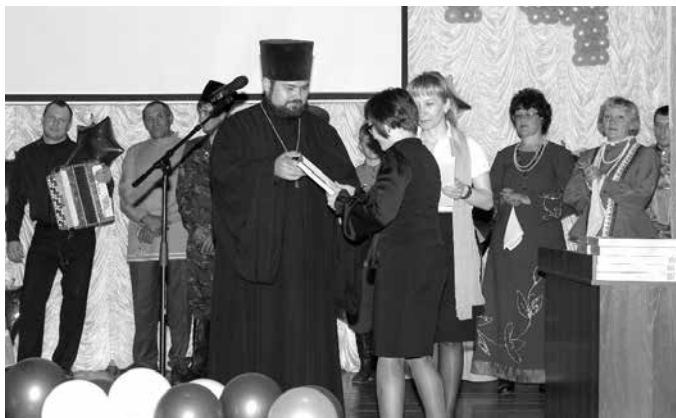
Торжественное вручение Благодарственных писем участникам Кирилло-Мефодиевских чтений

Получилась интересная беседа, в ходе которой участники чтений вспомнили, откуда появились наши письма, книги, библиотеки и школы, откуда произошло литературное богатство Руси. Чтения продолжил праздничный концерт с участием коллективов самодеятельности, активно сотрудничающих с Каинской епархией и КФ НГПУ. По благословению правящего архиерея Преосвященнейшего Владыки Феодосия настоятеля Прихода в честь Покрова Пресвятой