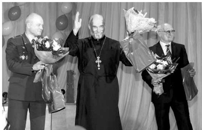
Создатели фильма «Меня это не касается»

Фильм снимался при активной поддержке управления ФСКН в реальных наркоманских притонах, с настоящими наркоманами, которые решили отказаться от пагубной зависимости и, находясь в реабилитационных центрах, играли реальные роли, надеясь уберечь