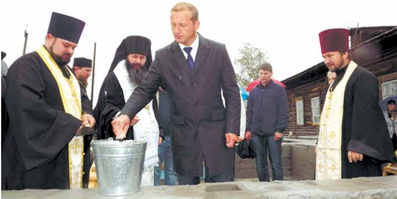
Чин закладки камня в основание храма в честь Святой Троицы

Не прошло и месяца с момента закладки камня, как уже завершаются работы по возведению стен нового храма, кроме того строители приступили к выкладке восьмигранника купола. Прихожане ждали этого момента 17 лет, вполне возможно, именно поэтому процесс строительства идет такими быстрыми темпами.