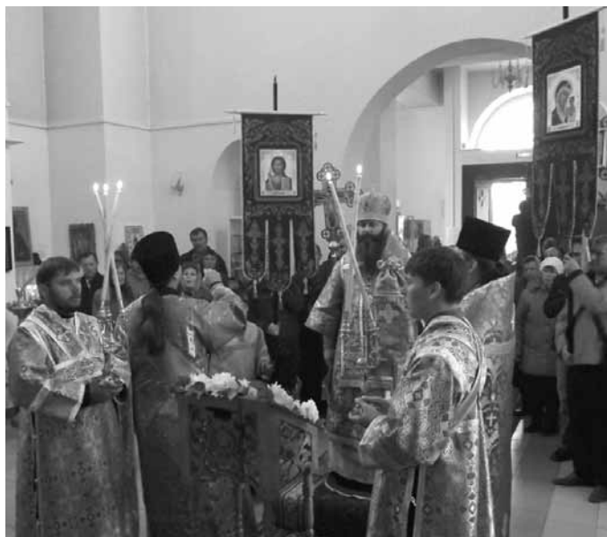
Божественная литургия в храме Рождества Пресвятой Богородицы в городе Чулыме

Пресвятая Дева Мария Своей чистотой и добродетелью превзошла не только всех людей, но и Ангелов, явилась живым храмом Божиим, и, как воспевают Церковь в праздничных песнопениях, «Небесной Дверью, вводящей Христа во Вселенную во спасение душ наших».