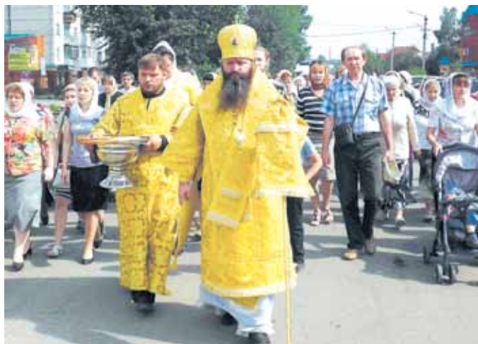
Крестный ход в честь празднования 1025-летия Крещения Руси

На Соборной площади (сквер им. В.В. Куйбышева) на месте разрушенного во время Советской власти Спасского собора состоялся молебен, на котором испрашивались молитвы «мира, любви и согласия» для нашей страны.