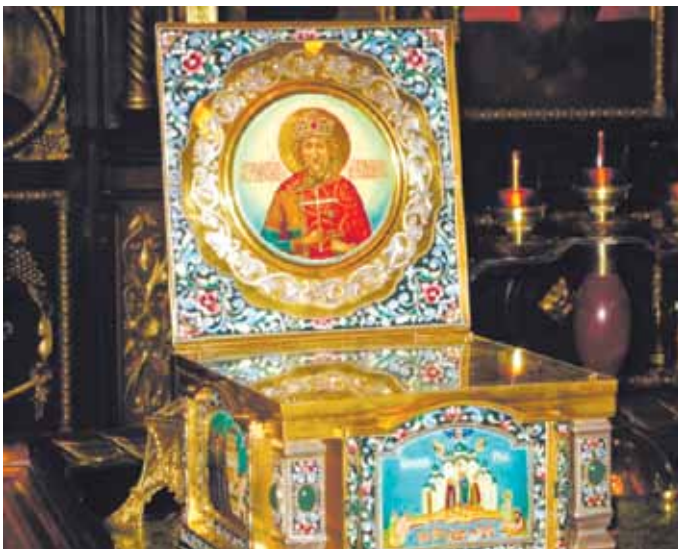
Частицы мощей святого благоверного князя Владимира

28 июля, в день памяти равноапостольного князя Владимира, православные верующие отмечали великий праздник — 1025-летие Крещения Руси. Торжества по этому случаю прошли в России, Украине и Белоруссии. В этом году отметить праздник было решено в международном масштабе.