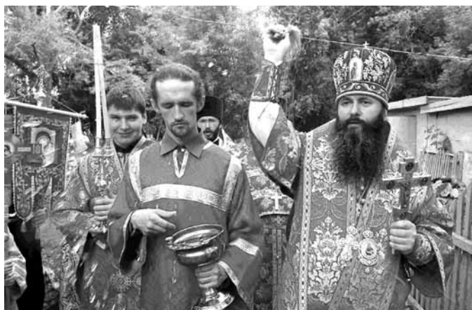
Крестный ход в посёлке Карачи