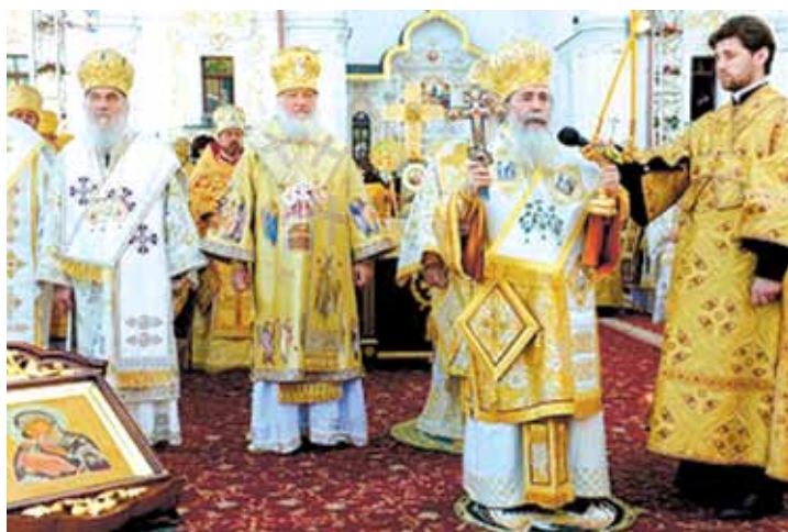
Патриарх Иерусалимский Феофил III (второй справа) и патриарх Московский и всея Руси Кирилл (третий справа) во время божественной литургии на Соборной площади Киево-Печерской Лавры в Киеве 28 июля 2013 года.

Затем торжества по случаю 1025-летия Крещения Руси переместились в столицу Белоруссии.