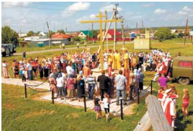
Поклонный крест в р.п. Коченёво

На подходе к Поклонному кресту, на месте разрушенного в годы советской власти храма во имя Архистратига Михаила, в той части посёлка, которая издавна называется Камышенка, Крестный ход встречал звон колоколов.