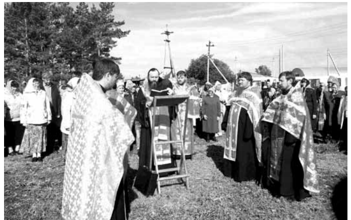
Водосвятный молебен с акафистом Параскеве Пятнице возле святого источника «Половинка»

В конце торжественного пения акафиста Владыка обратился к верующим с архиерейским словом.