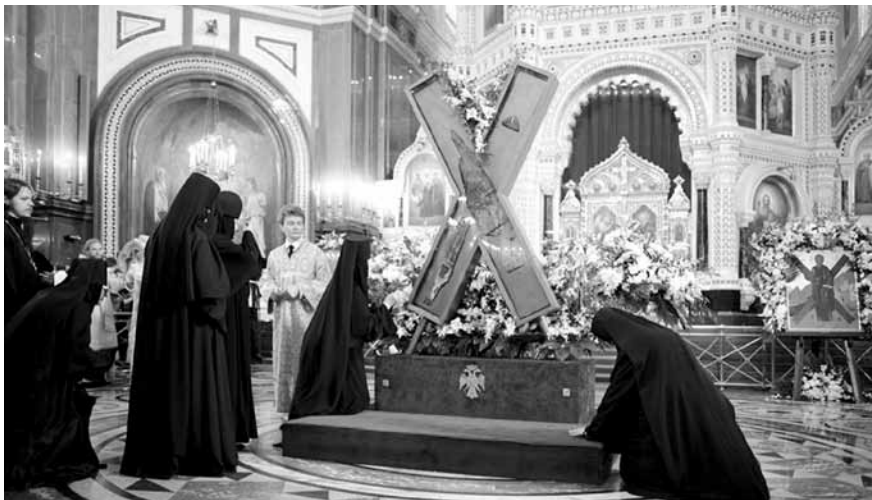
Крест святого всехвального апостола Андрея Первозванного

В центре Храма Христа Спасителя находилась великая христианская святыня — Крест святого всехвального апостола Андрея Первозванного. По окончании Божественной литургии, в Трапезных палатах кафедрального соборного Храма Христа Спасителя в Москве состоялся прием по случаю празднования 1025-летия Крещения Руси.